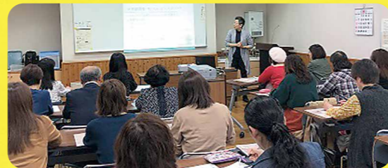
公民館での講座の様子

*お気軽にお問い合わせください。 千葉市男女共同参画センター TEL 043-209-8771 E-mail sankaku@f-cp.jp