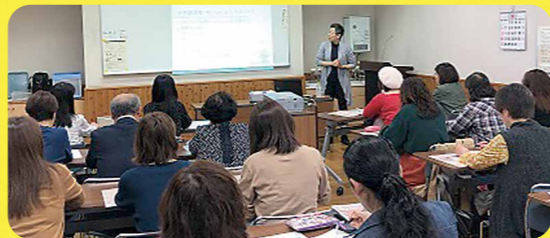
公民館での講座の様子

*お気軽にお問い合わせください。 千葉市男女共同参画センター TEL 043-209-8771 E-mail sankaku@f-cp.jp