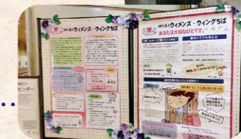
市民活動団体資料展示