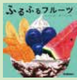
ふるふるフルーツ ひがしなおこ / 文、 はらぺこめがね / 絵 学研教育みらい 2018