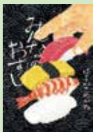
みんなのおすし はらぺこめがね / 著 ポプラ社 2019