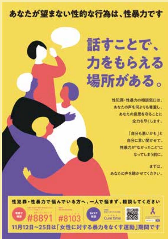
令和4年度啓発ポスター