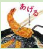
あげる はらぺこめがね / 著 佼成出版社 2022